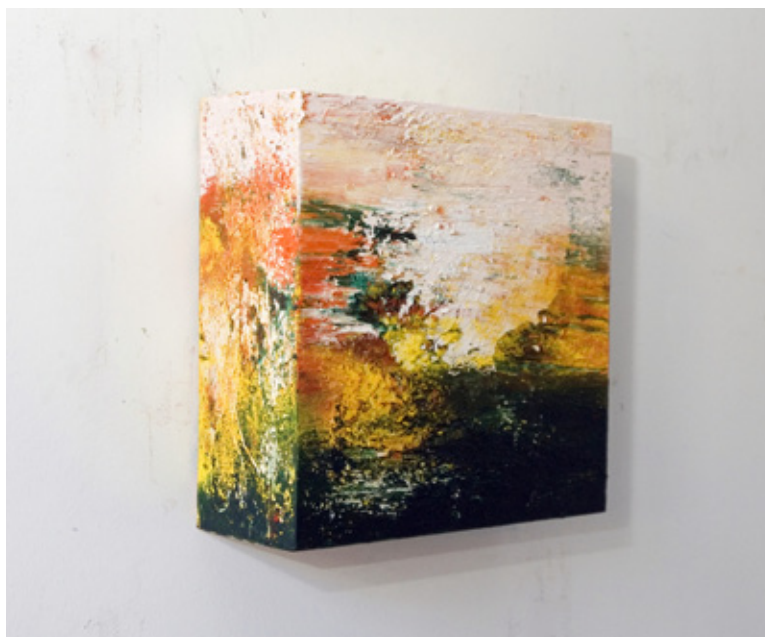
Little Fields of Colour, 2007, 34x34x13cm, Acrylique sur toile

nant. Il dit désirer que cette pratique « transforme l'idée de la plate peinture traditionnelle pour qu'elle coexiste avec l'espace qui l'entoure ». Il réunit ces différents fils en un unique panorama spatial permettant à l'imagination et au regard de partager une même expérience. En entrant dans cette exposition nous sommes subsumés par « l'intime immensité » décrite par Bachelard.