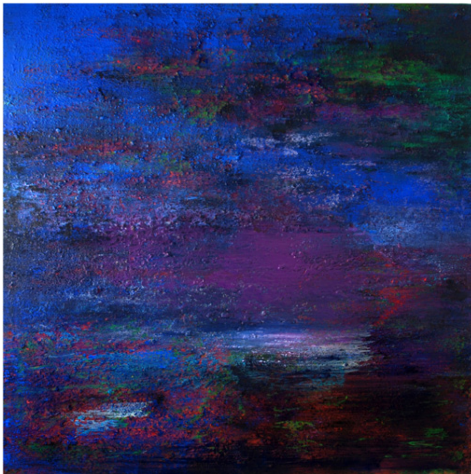
Pensamientos Nocturnos, 2009, 200x200x12 cm, Acrylique sur toile

Ce qui distingue cette exposition ce sont des tableaux qui assument plus décisivement et solidement les trois dimensions. Reguera crée ici une tranche plus solide et plus épaisse (l'objet en lui-même est moins qu'un cube mais plus qu'une lamelle) afin de montrer des peintures que l'on regarde en tour-