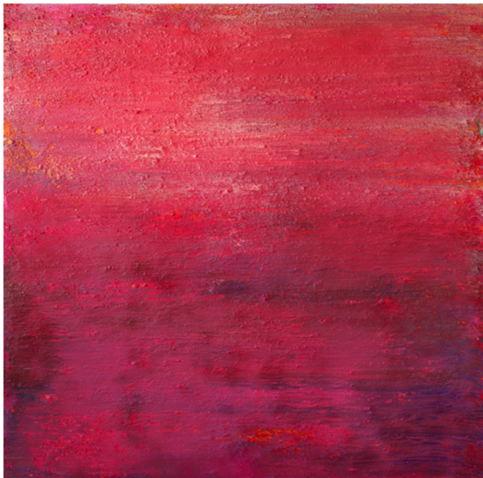
Foggy Skies, 2010, 130x130x12cm, Acrylique sur toile