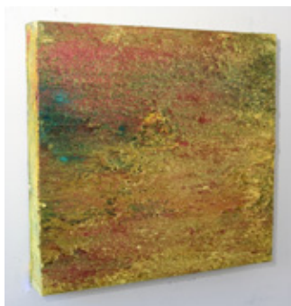
Aerial Views , 2006, 80x80x13cm, Acrylique sur toile

The artist points out in his work Maritime Fragments (2008) as being a gesture referencing Caspar David Friedrich's opus Monk by the Sea (1809), one of the early landscapes to veer away from landscape painting's traditional composition. Reguera elegantly lifts an obscure part of this picture—a point within the dark, turmoil of the sea—and with a lyrical layering of Prussian blue, amidst peeping flecks of russet, meditates on its sentiment. This work places us solidly within Reguera's sustained discourse of the possibilities of the painted landscape. Reguera's works are thus, securely planted within the act of painting itself. He suffuses his works with color, and concerns