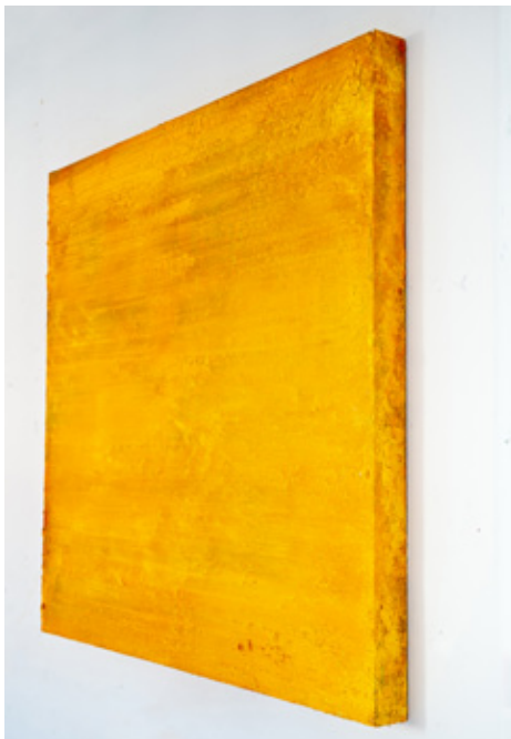
Solar Fragments, 2010, 140x140x9cm, Acrylique sur toile