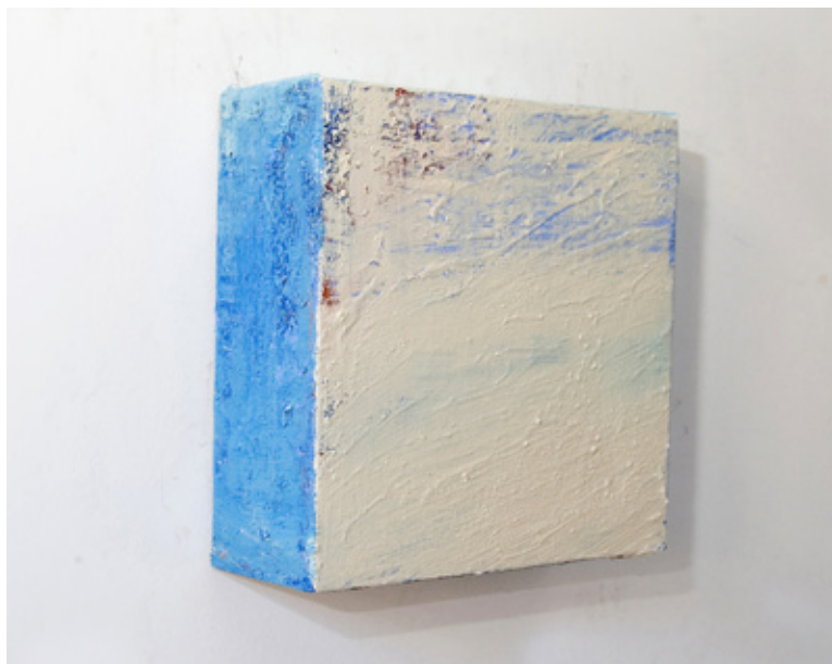
Stratus Nebulus , 2007, 34x34x13cm, Acrylique sur toile

L'artiste nous dit que Maritime Fragments (2008) est issu de Moine au bord de la mer (1809) de Caspar David Friedrich, l'un des premiers paysages à s'éloigner de la composition traditionnelle de la peinture de paysage. Reguera dévoile élégamment une partie obscure de cette image, un point dans le ténébreux tourbillon de la mer, et avec une couche lyrique de bleu de Prusse dans de rousses éclaboussures médite sur le sentiment qui s'en dégage. Cette œuvre nous installe au cœur même du constant discours de Reguera sur les possibilités du paysage peint.