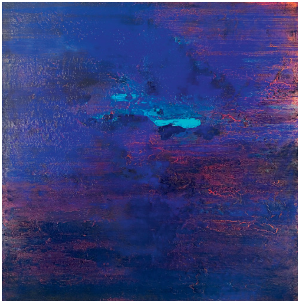
Maritime Fragments, 2008, 200x200x12 cm, Acrylique sur toile

Reguera collapses these diverse threads onto a single spatial panorama, enabling the imagination and the gaze to assume a single experience. It is when we step into this exhibition that we find ourselves subsumed by the ‘intimate immensity’ described by Bachelard.