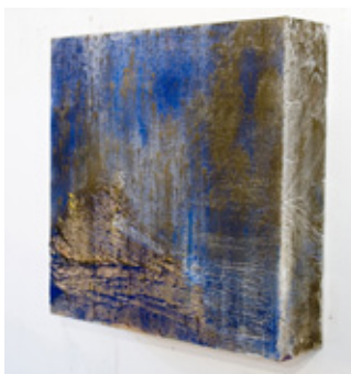
Coloured Storms , 2007, 50x50x13cm, Acrylique sur toile