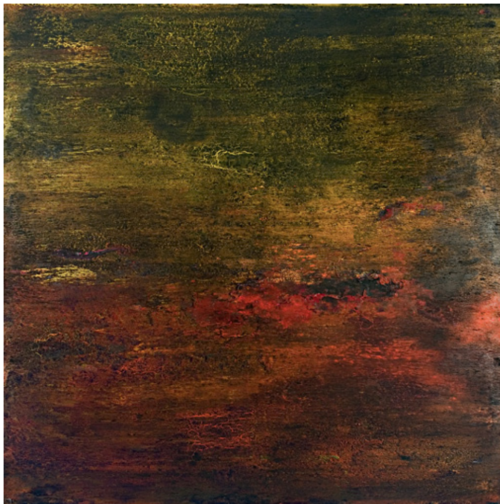
Nocturnal Territories, 2008, 200x200x12 cm, Acrylique sur toile

Reguera inscrit donc fermement son travail dans l'acte de peindre. Ses œuvres sont baignées de couleur, il se soucie de touches et d'unité, de profondeur et de luminosité. Il n'est pas de ceux qui créent des toiles découpées, les détruisent, les extirpent de leur châssis, ou les jettent comme des rebus dans un espace, gestes qui sont autant de contestations contre la finitude de la peinture sur un format carré. Bien au contraire, il confirme la véritable « picturalité » de la peinture et, fort de la richesse de ses préceptes historiques, s'interroge sur ses possibilités. Séparément, chacune de ses œuvres conduisent l'abstraction en tant que paysage loin du naufrage des